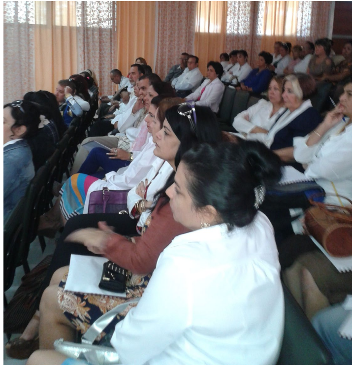
Figura 3. Delegados participantes en la jornada.

La Primera Jornada Provincial propició un fructífero debate científico y experiencial entre afiliados y no afiliados, profesionales y estudiantes, y entre investigadores y directivos, así como contribuyó a consolidar criterios sobre el fortalecimiento organizacional del capítulo y a cohesionar, mediante el desarrollo de actividades científicas y sociales al capital humano, profesional y técnico que realiza labores de salud pública en la provincia de Ciego de Ávila. Sus memorias quedaron grabadas con carácter de publicación en evento científico en un CD-ROM con el número de ISBN: 978-959-16-3244-9, gracias a la colaboración del Centro de Información de la Universidad "Máximo Gómez Báez" de Ciego de Ávila.