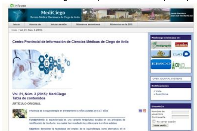
Figura No.4. Actual formato de MediCiego en la plataforma OJS (2015).

En estos veinte años el equipo editorial ha ganado en experiencia, se ha renovado y la tecnología ha avanzado para brindar posibilidades antes insospechadas, pero en MediCiego hay –como en