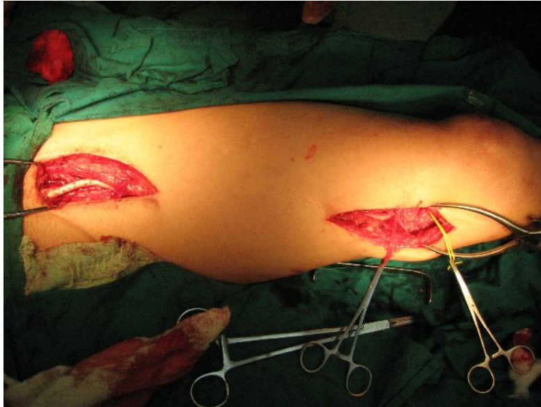
Figura No.3. Derivación femoro-poplíteica izquierda. Anastomosis del término lateral del injerto protésico con la arteria femoral común izquierda y del término lateral del injerto protésico con la arteria poplíteica izquierda.

Transcurrido un año de las operaciones el paciente se reincorporó a su vida laboral y social, sin signos de claudicación durante la marcha; en el examen físico se constató su buen estado general: miembros inferiores normotérmicos, ausencia de cianosis y palidez, recuperación del vello cutáneo y presencia de los pulsos distales (femoral, poplíteo, tibial posterior y pedio) con intensidad y frecuencia fisiológicas normales en ambos miembros inferiores, lo que evidenció la permeabilidad del injerto protésico.