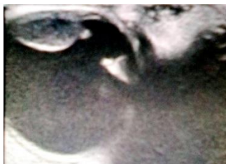
Fig. 2 - Ultrasonido ocular del ojo derecho. Obsérvese la masa sólida que sobresale hacia el interior del globo ocular.

Se indicó una resonancia magnética nuclear que informó cambios en la intensidad de la señal en proyección anterior del globo ocular derecho y desestructura los componentes del mismo con aspecto oncoproliferativo. No se observaron lesiones en la órbita y sus estructuras. (Fig. 3)