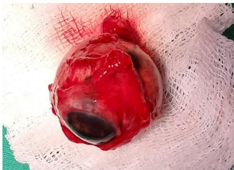
Fig. 4 - Imagen de la base de datos de la consulta de oculoplastia. Órgano enviado a anatomía patológica para biopsia.

La operación transcurrió sin complicaciones. La biopsia reveló: globo ocular de 2,5 cm de diámetro con fragmentos del nervio óptico; córnea oscura de 1,5 cm de diámetro, sin hemorragia; humor vítreo turbio con presencia de fragmento de pigmentación melánica en la coroides y cámara posterior consistente con un melanoma uveal.