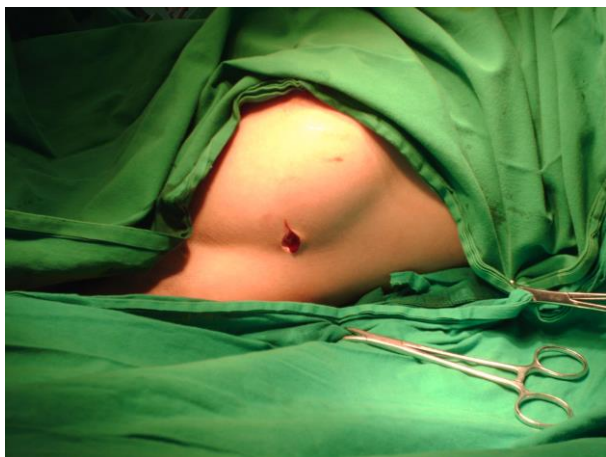
Figura No.1. Incisión del puerto de entrada.