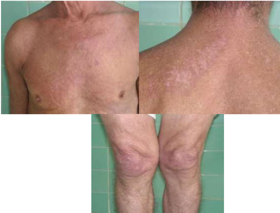
Principales localizaciones con lesiones de piel.