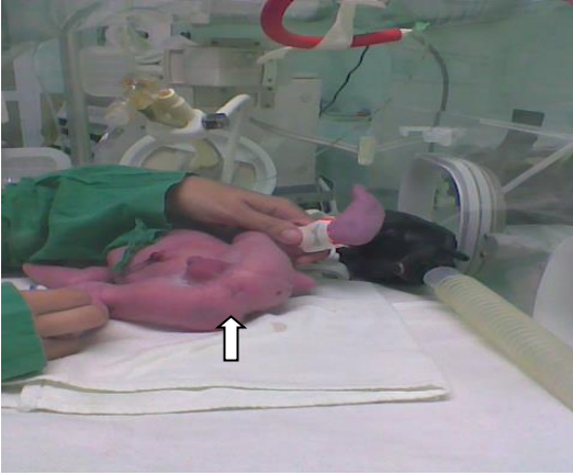
Figura No. 2. Presencia de ano imperforado