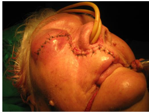
Foto No. 2C. Post operatorio inmediato y taponamiento nasal.