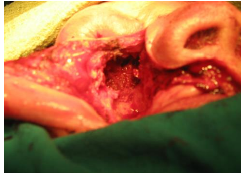
FOTO No. 2A. Maxilectomía mas enucleación del globo ocular.