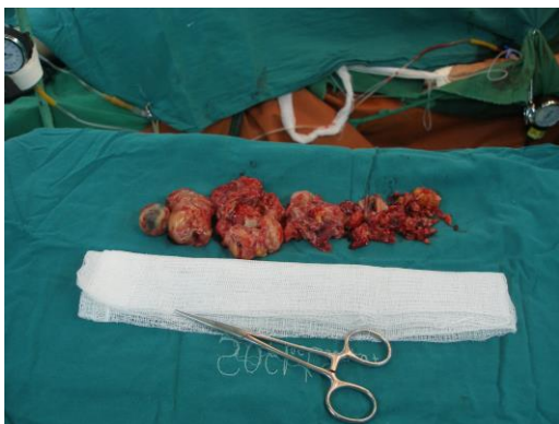
Foto No. 1B. Foto No. 1B. Tumor nasosinusal con el globo ocular.