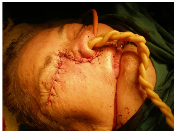
Foto No. 1C Cierre de la herida quirúrgica y taponamiento nasal con sonda vesical de balón.