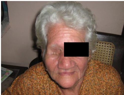
Foto No. 2D. Post operatorio de 3 años de evolución, sin recidiva tumoral.