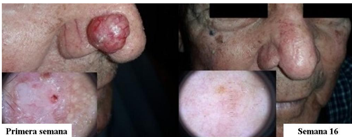
Fig. 2 – Segundo paciente, antes y después del tratamiento. Obsérvese la remisión de las lesiones.

Se le realizó dermatoscopia inicial y examen histológico del área eritematosa, con resultado diagnóstico de CBC nodular. Se le indicó tratamiento con HeberFERON®. En la figura 2 se observan los resultados positivos del tratamiento al cabo de 16 semanas.