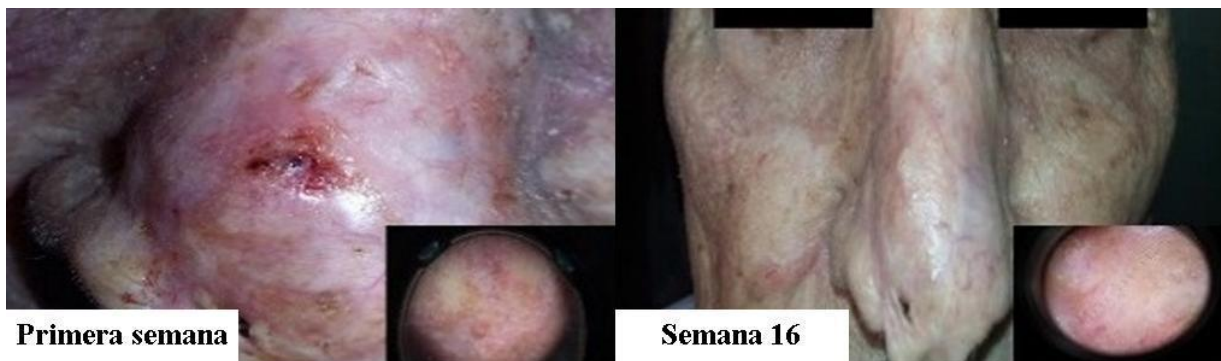
Fig. 3 – Tercer paciente, antes y después del tratamiento. Obsérvese la remisión de las lesiones.

Durante la anamnesis refirió haber sido intervenido quirúrgicamente por el especialista en cirugía maxilofacial en dos ocasiones, de lo que son evidencia las cicatrices. Se le realizó dermatoscopia inicial y examen histológico, lo cual derivó al diagnóstico de CBC ulcerado. Se le indicó tratamiento con HeberFERON®, cuyos resultados se aprecian en la figura 3.