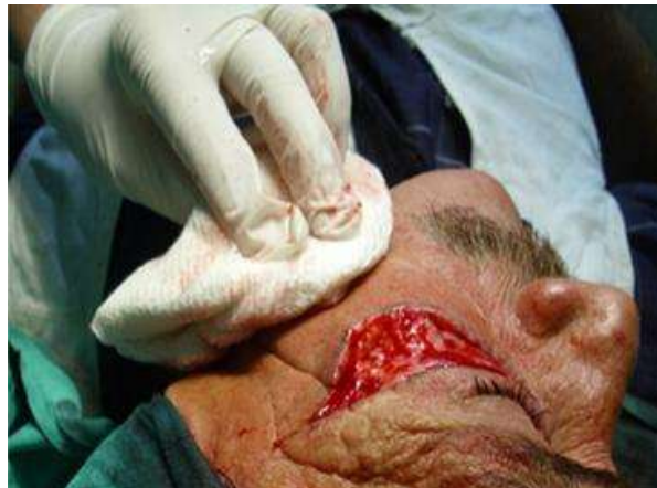
Fig. 3 - Luego de la infiltración con anestesia local se realizó la incisión y se extrajo la lesión, manteniendo la hemostasia del paciente.