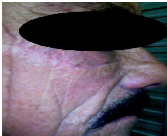
Fig. 6 - Aspecto del paciente una semana después de la intervención quirúrgica.

Respecto al tratamiento médico, pasados 30 días de la intervención quirúrgica, al paciente se le aplicó en la zona de la operación crema de Adapaleno 0,1 % en horario nocturno, durante 30 días. Se le