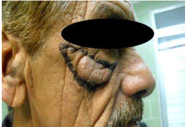
Fig. 2 - Previa asepsia y antisepsia de la zona afectada, se procedió a su marcación con un losange o semiluna.

Respecto al tratamiento quirúrgico, se realizó una autoplastia de vecindad por deslizamiento frontal, que cerró por sí sola la zona afectada tras la extirpación quirúrgica (Fig. 2, 3, 4, 5 y 6).