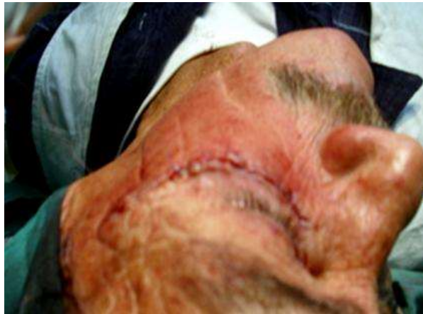
Fig. 5 - Se realizó cierre intradérmico de la incisión con sutura de nailon 5.0.