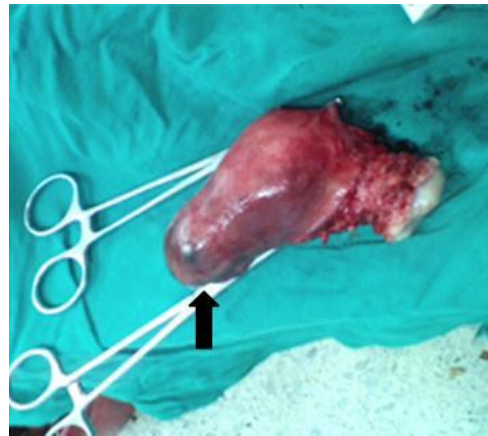
Fig. 2 – Útero extraído. Obsérvese el cuerno derecho, sitio de implantación del embarazo heterotópico cornual.

En el diagnóstico anatomopatológico se identificaron el cuello del útero con algunos quistes de Naboth y cervicitis crónica leve, y en el cuerno uterino derecho una cavidad de 3 cm, con líquido y un embrión de 1 cm. La cavidad uterina, dilatada, contenía un dispositivo intrauterino. El endometrio tenía hiperplasia simple y atopia de Arias-Stella.