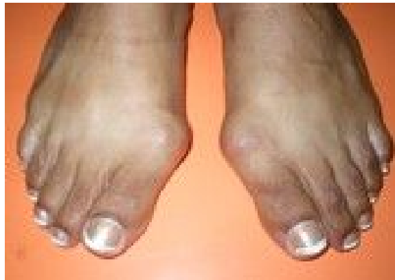
Figura No.1. Hallux Valgus.

Estudios realizados corroboran el hecho que el hallux valgus constituye una problemática vigente en el mundo (1-4) ; la población cubana no está exenta de padecerla, se extiende a todos los niveles, desde el nacional hasta el local. Pese a todos los esfuerzos realizados en el orden preventivo y asistencial –en el caso de Cuba, se coordina y desarrolla el Programa de Detección y Atención de Deformidades del Pie, perteneciente al Ministerio de Salud Pública– continúa siendo una prioridad dadas la prevalencia e incidencia de la morbilidad de esta dolencia y sus principales consecuencias.