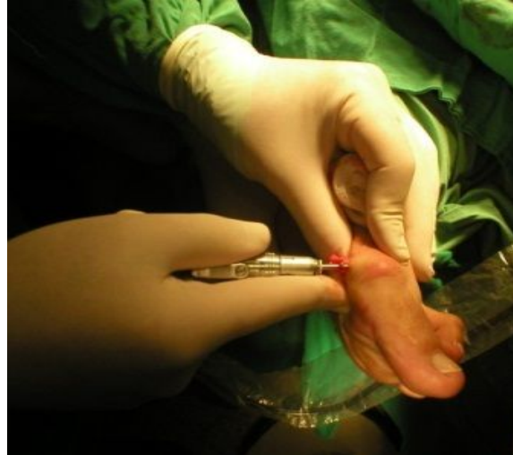
Fig. No.2. Exostectomía.

Osteotomía distal del primer metatarsiano: por la misma incisión empleada para realizar la exostectomía, se practica, con fresa Shannon 44, la osteotomía descrita por Isham –modificación de la osteotomía de Reverden– de trazo oblicuo dorsal-distal y plantar-proximal, de 45° aproximadamente, y con cuña interna (Figura No.3).