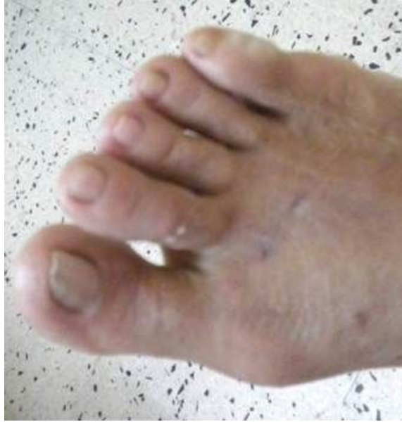
Figura No.6. Resultado postoperatorio.

Aunque se han demostrado mejores resultados en el tratamiento quirúrgico, en la actualidad existen más de 130 técnicas descritas y constituye un reto para el cirujano ortopédico seleccionar la mejor; cobra auge la utilización de técnicas mini-invasivas o percutáneas que resuelven o minimizan algunos de los problemas planteados en la cirugía abierta (disminuyen las posibles complicaciones, mejoran y acortan el proceso de recuperación posquirúrgica). Las investigaciones realizadas hasta el momento sólo se enmarcan en demostrar la eficacia de este novedoso método, dejando a un lado el estadio evolutivo de la entidad, lo cual pudiera llegar a solucionar el problema y conjuntamente con él todas las demás enfermedades que puede desencadenar o agravar.