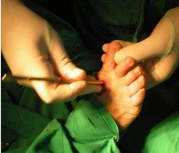
Figura No.4. Tenotomía y capsulotomía lateral a visión directa.