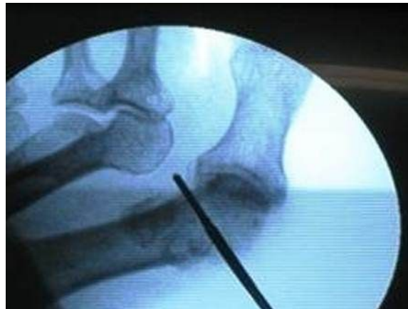
Figura No.3. Osteotomía distal del primer metatarsiano a visión radiológica.

Osteotomía proximal del primer metatarsiano: se realiza por vía dorsal, a nivel de la base del metatarsiano, con inclinación de 45° respecto al plano del suelo, en dirección distal-dorsal a plantar-proximal, desde la cortical superoexterna hacia la superointerna, respetando una mínima cantidad de esta última cortical y extrayendo una cuña de base externa de mayor o menor amplitud en función del ángulo intermetatarsal a corregir.